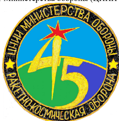
Рис. 2. Эмблема ЦНИИ 45 Министерства обороны

незначительно изменялось, и 29 июня 1989 года институту было присвоено название 45-й Центральный научно-исследовательский институт Министерства обороны (ЦНИИ 45 МО).