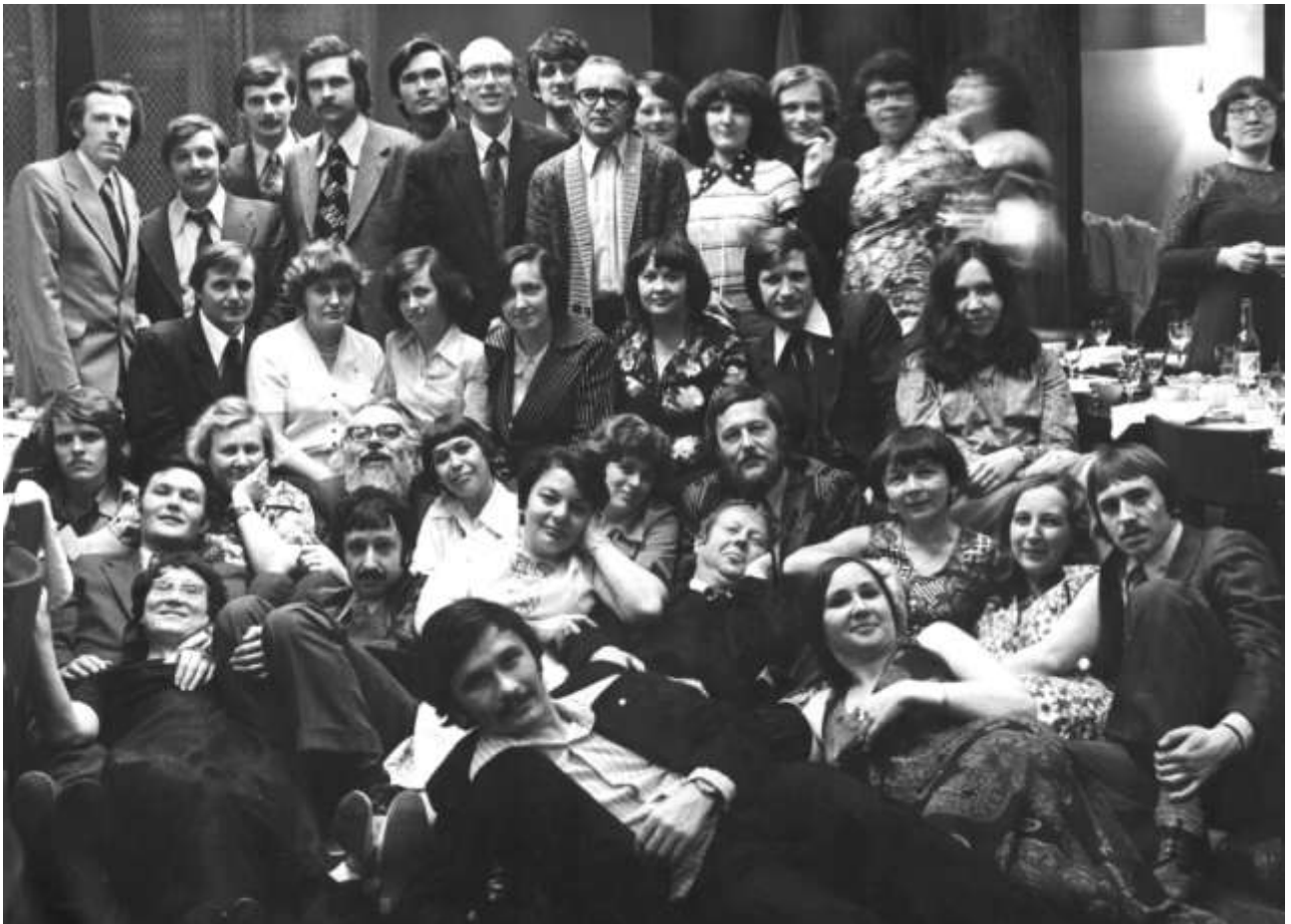
20 лет Отделу программирования ВЦ СО АН